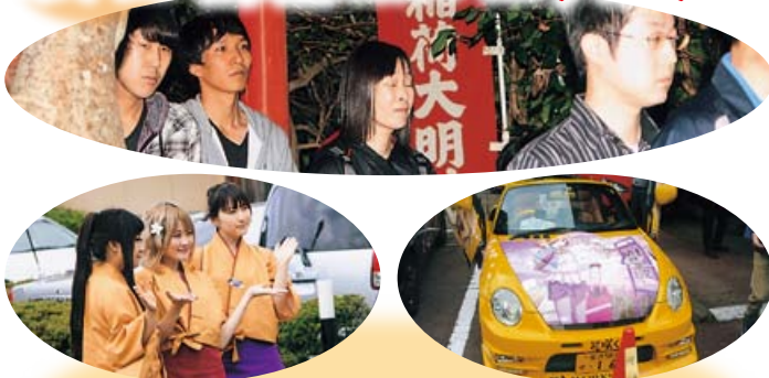
昨年と同じく若者を中心とした人・人の波で埋まる