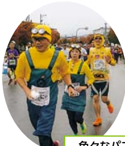
色々なパフォーマンス