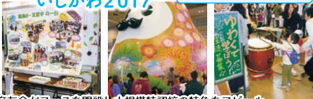
育友会がブースを開設し小規模特認校の特色をアピール