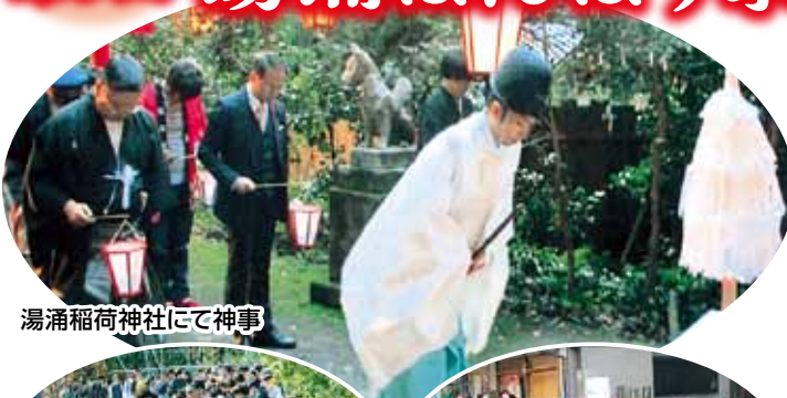
湯涌稲荷神社にて神事