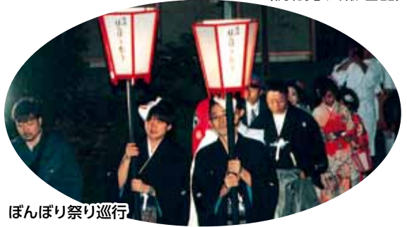
ぼんぼり祭り巡行