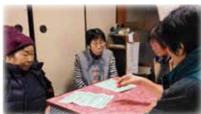
各地域サロン等で聞き取り調査を実施

※アンケート調査結果抜粋 現在はまだ過不足なく生活できている方が多いが、今後、更に高齢化が進む中で、5年・10年先にはニーズが増加する見込み。先を見据えた地域福祉の在り方を考えていく必要性を感じる。