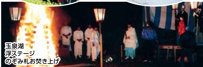
玉泉湖 浮ステージ のぞみ札お焚き上げ