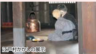
江戸村かかし の 展示