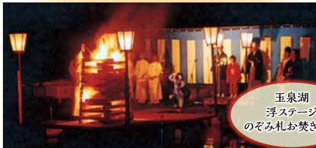
玉泉湖 浮ステージ のぞみ札お焚き上げ