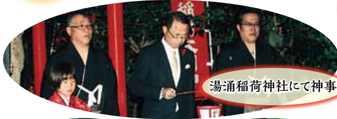
湯涌稲荷神社にて神事