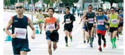
湯涌校下から7名の方が参加しました