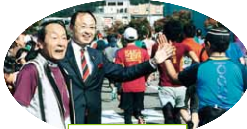
市長もハイタッチで応援