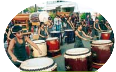
湯涌ちびっこどこん鼓真