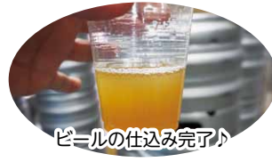
ビールの仕込み完了