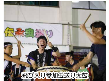
飛び入り参加虫送り太鼓