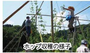
ホップ収穫の様子

昨年10月に湯涌に移り住みもうすぐ一年。この間、協力隊として主に食肉加工品や調味料、保存食などの試作や休耕地などを利用した大麦とホップの栽培に取り組んできました。そしてこの秋、製造した保存食の試験販売と、収穫した湯涌産原料を使ったビール醸造が実現します。こうして、花咲く湯涌プロジェクトメンバーの方々をはじめ、住民の皆さまの温かいご支援とご協力により、一年間協力隊として活動を進めることができました。心よりお礼申し上げます。ありがとうございました。この10月から任期2年目に入ります。これまでの取り組みをはじめの一步として、また新たな一步を踏み出していきたいと思っております。これまでと変わらぬご支援・ご協力を宜しくお願い致します。