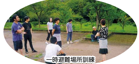
一時避難場所訓練