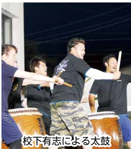
校下有志による太鼓