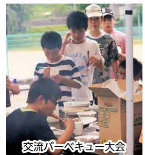
交流バーベキュー大会