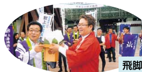
飛脚「氷室氷」運搬 湯涌～金沢駅鼓門