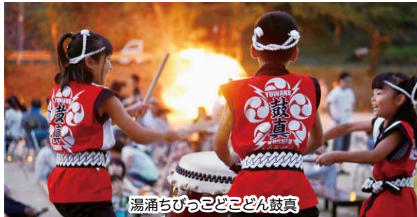
湯涌ちびっこどん鼓真