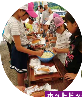
ホットドッグ作り