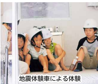
地震体験車による体験