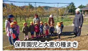
保育園児と大麦の種まき