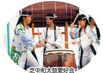
芝中和太鼓愛好会