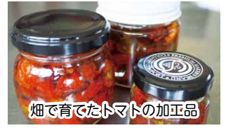
畑で育てたトマトの加工品