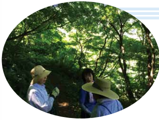
高尾山登山口周辺散策