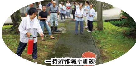
一時避難場所訓練