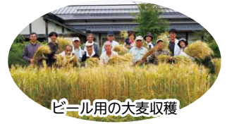
ビール用の大麦収穫