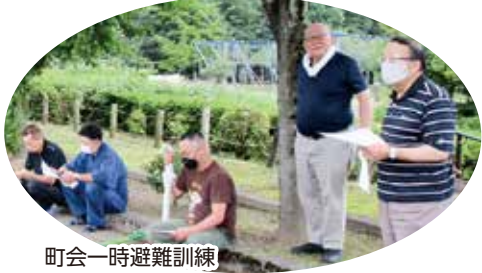
町会一時避難訓練