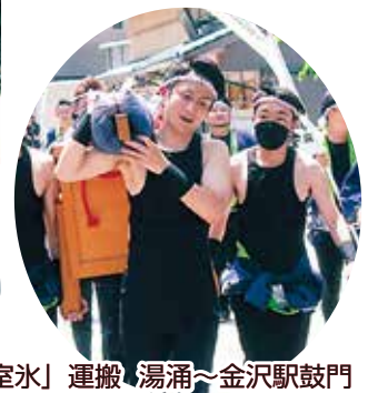
飛脚「氷室氷」運搬 湯涌~金沢駅鼓門