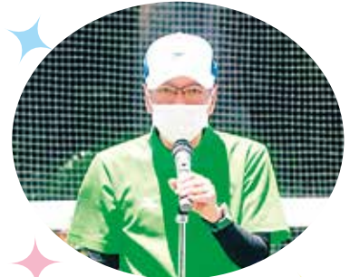
新井公民館長挨拶

今年、二年ぶりに公民館、保育園との合同開催が実現しました。それは感染症対策を計画し、スムーズに行けるようにお手伝い頂いたり皆様のご協力、ご理解頂けたからこそだと思います。 二年ぶりの合同開催ということで、会場はコロナ禍前の様に賑やかでした。公民館さんには感染症対策を行った新種目を考えてもらい、子供達もとても楽しんでいました。特に「君も明日からメジャーリーガー」はとても評判がよく子供達から「楽しかった」という声を多く聞き、わたしはとても嬉しく思いました。更には、熱中症対策としてかき氷を用意してくださり、子供達の喜んでいる顔がとても印象に残っています。本当にありがとうございました。 今回、学校と地域が連携することにより、コロナ禍でもスポーツフェスティバルを盛大に行うことができ、無事に成功できたことを嬉しく思います。 最後に、来年こそはノーマスクで一日開催ができるよう、コロナの終息を願います。