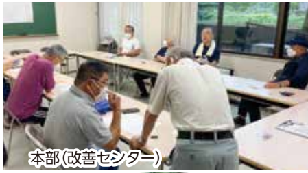
本部(改善センター)