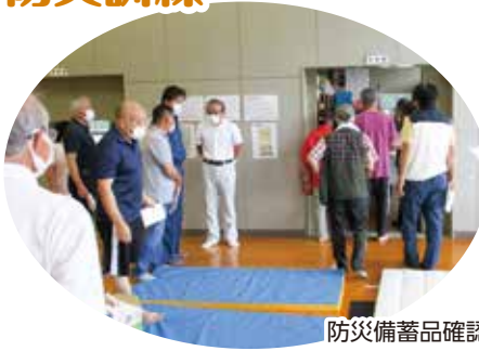
防災備蓄品確認(学校倉庫)